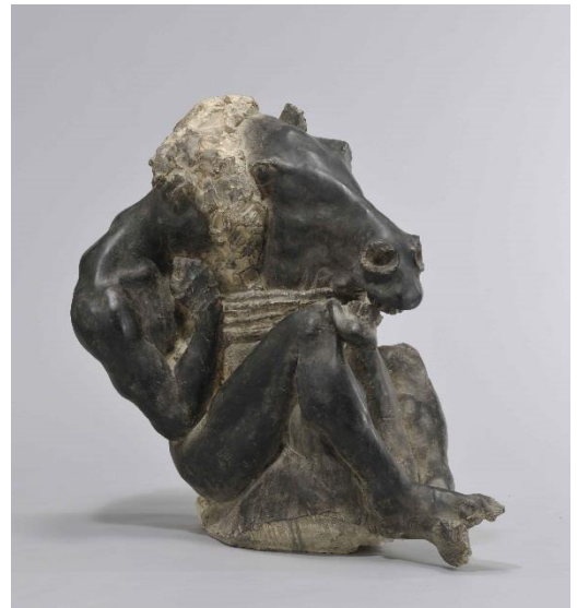
田丸稔《叙事詩の男と馬》 2012年 FRP