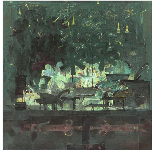
高島圭史《旅にでた庭師》 2014年 紙本彩色