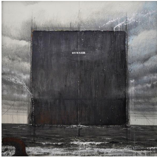
瀬島匠《RUNNER 2014》2014年 油彩、ミクストメディア

※掲載用素材として、下記の画像5点をご用意しております。 ご希望の際は、別紙の申込用紙に必要事項をご記入の上、FAXにてお申し込みください。