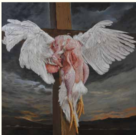
《終わり、または始まり》2011年