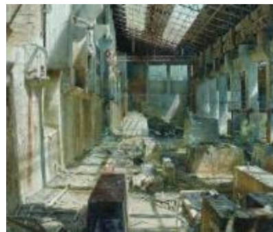
17. [独立美術協会] 橋本大輔 《標》 油彩、パネル 個人蔵 (参考作品)