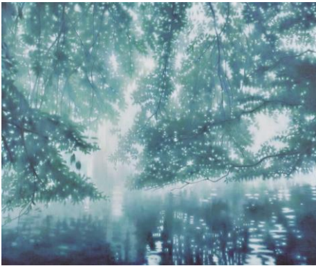
11. [春陽会] 畠山昌子 《Vision 150401》 2015年 油彩、方解末、カンヴァス 作家蔵