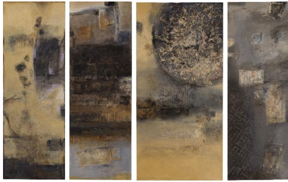
10. [主体美術協会] 水戸部千鶴 《時の痕跡》 2015年 アクリル、紙、カンヴァス、パネル 作家蔵