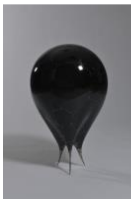
22. [日展] 青木宏懂 《浮上》 2013年 乾漆、蒔絵、漆、 麻布、銀粉、鉄 作家蔵