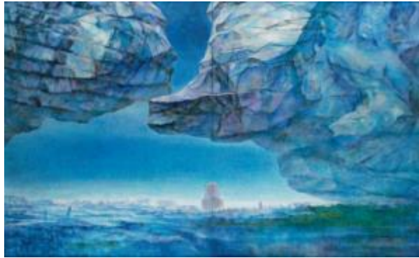
2. [一水会] 田島健次 《伝道の泉》 2015年 油彩、カンヴァス 個人蔵