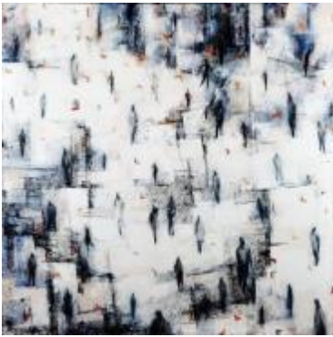
3. [旺玄会] 中村章子 《ひとの風景》 2016年 油彩、木炭、カンヴァス 作家蔵