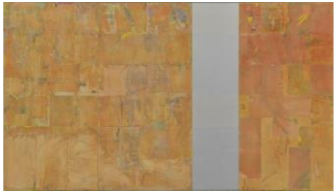
12. [新制作協会] 木嶋正吾 《霧形 15-1》 2015年 ミクストメディア 作家蔵