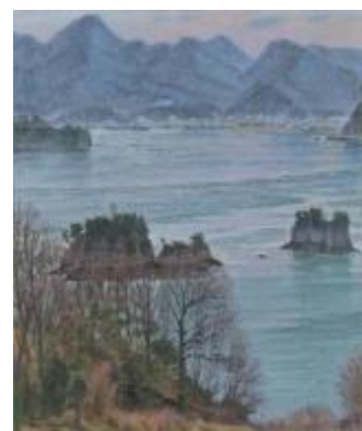
20. [日洋会] 三原捷宏 《海峡・舟折りの瀬戸》 2015年 油彩、カンヴァス 作家蔵 (参考作品)