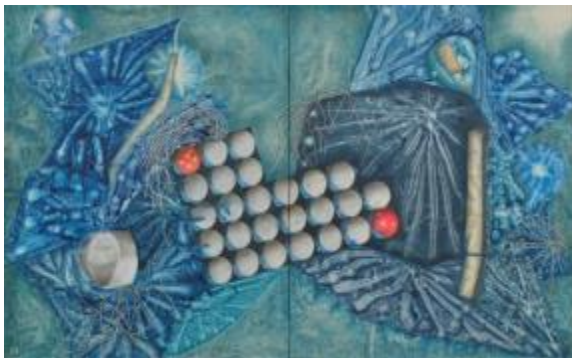
28. [美術文化協会] 東 俊一 《連鎖のゆくえ 014-09 (漏洩)》 2015年 油彩、和紙、カンヴァス 作家蔵