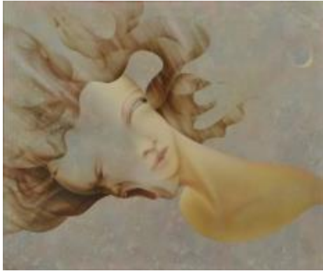
1. [一陽会] 大場吉美 《月・ゆらぎ》 2015年 アクリル、カンヴァス 作家蔵

ご希望の際は、別紙の申込用紙に必要事項をご記入のうえ、FAXにてお申し込みください。