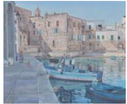
5. [光風会] 長谷川 仝 《朝・古い港で》 2015年 油彩、カンヴァス 作家蔵