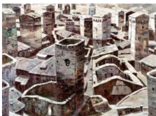
19. [二紀会] 難波平人 《銃眼塔を持つ村ウシュグリ (ジョージア)》 2014年 油彩、カンヴァス 作家蔵