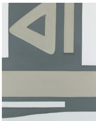
18. [二科会] 吉井英二 《コンポジション》 2015年 油彩、カンヴァス 作家蔵