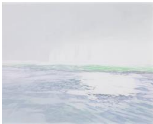
14. [創画会] 津田一江 《洋・驟雨》 2015年 紙本彩色 作家蔵