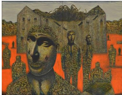
4. [行動美術協会] 石原恒人 《僕の居場所》 2015年 アクリル、パネル 作家蔵