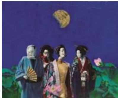
16. [東光会] 難波 滋 《逍遙・夕月》 2013年 油彩、箔、カンヴァス 作家蔵