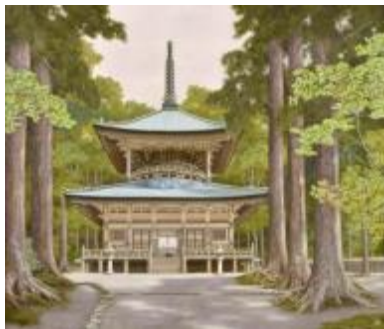
15. [創元会] 松崎良夫 《壮麗・高野山西塔》 2015年 油彩、カンヴァス 作家蔵