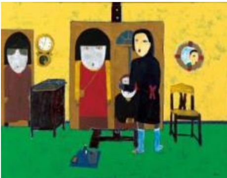
6. [国画会] 井上 悟 《声にならない》 2014年 油彩 作家蔵