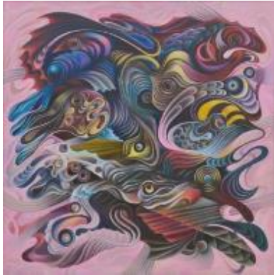
9. [自由美術協会] 村田知子 《海の事件》 2014年 油彩、カンヴァス 作家蔵