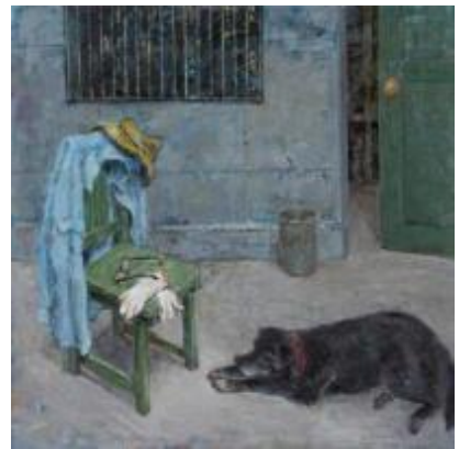
8. [示現会] 瀧井利子 《父のいた作業場 待つ》 2015年 油彩、カンヴァス 作家蔵