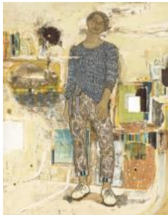
26. [日本美術院] 國司華子 《理》 2015年 紙本彩色 足立美術館蔵