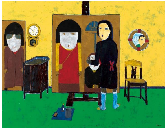
〔国画会〕井上悟《声にならない》2014年