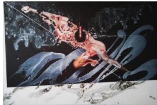
29. [モダンアート協会] 立花古陸 《Blackout》 2013年 油彩、アクリル、カンヴァス、コラージュ 作家蔵