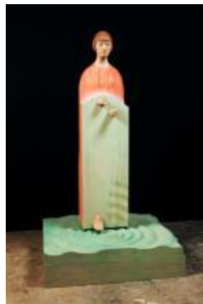
7. [国画会] 笠原鉄明 《揺らく月》 2014年 樟 作家蔵