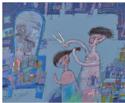
23. [日本水彩画会] 宗廣恭子 《ヘアサロン》 2015年 アクリル、紙 作家蔵