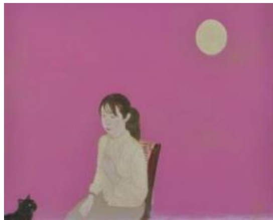
27. [白日会] 丸山 勉 《十三夜》 2014年 アクリル、金泥、カンヴァス、パネル 作家蔵