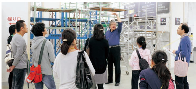
美術館たんけんツアー

「建築ツアー」は、建築家・前川國男の設計による当館の建物の魅力を知ってもらうツアー。とびラーの案内で、当館のあちこちを散策する。奇数月第3土曜日14時から開催。案内人のオリジナリティーが発揮された、それぞれ独自のツアーを展開。6回開催、のべ参加者数126人。平成26年度は前年度に引き続き、昼の開催に加え、ライトアップされた当館を散策する「トビカン・ヤカン・カIKAN・ツアー」がとびラーからの発案により開催された。12回開催、のべ参加者数223人。また、とびラーによるトビカンケンチク見どころマップvol.1、2、「上野の杜の宝石箱」東京都美術館ヤカン・ミドコロ・スポット」が引き続き配布された。