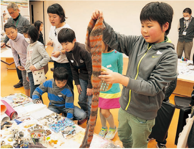
ホームカミングデイ