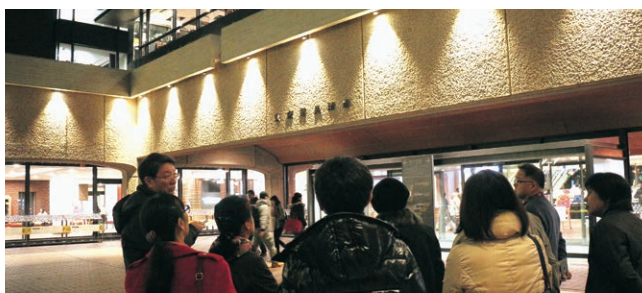
トビカン・ヤカン・カIKAN・ツアー