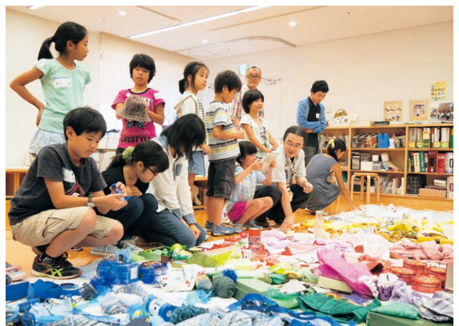
Hi! Zai アートラボ

身の回りにあるありふれた廃材が、魅力ある創作の材料に変身していく「クリエイティブリユース」のワークショップ。廃材という素材に触れ、その由来を考えたり、分類したり、手を動かして、集まった仲間たちと豊かなコミュニケーションをとりながら作品を制作。日々の暮らしを楽しくするプログラム。