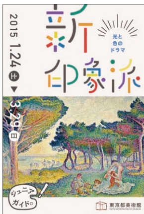
新印象派展 ジュニアガイド

中学生以下の子どもたちが展覧会を楽しみ、学ぶ助けとなるジュニアガイドを制作。都内の小・中学校などには事前に送付し、会場でも配布した。当館のウェブサイトからもダウンロードできる。「メトロポリタン美術館 古代エジプト展 女王と女神」には、会場の地図をデザインしたガイドを作成、「新印象派—光と色のドラマ」展では点描などの技法に着目したガイドを作成した。