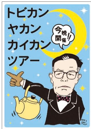
トビカン・ヤカン・カイカン・ツアー (とびらボ発プログラム)