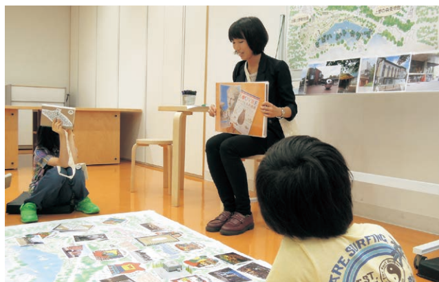
インターンシップの実践研修(Museum Start あいうえのプログラム)

学芸員を目指す学生や、美術館活動を支える専門的な人材育成を目的とする。主に大学院修士課程に在籍する学生を対象に、最長で1年間、年に若干名をインターン生として受け入れている。アート・コミュニケーション事業業務の補佐として従事、現場を通して学ぶ機会を提供している。今年度は2人を受け入れた。