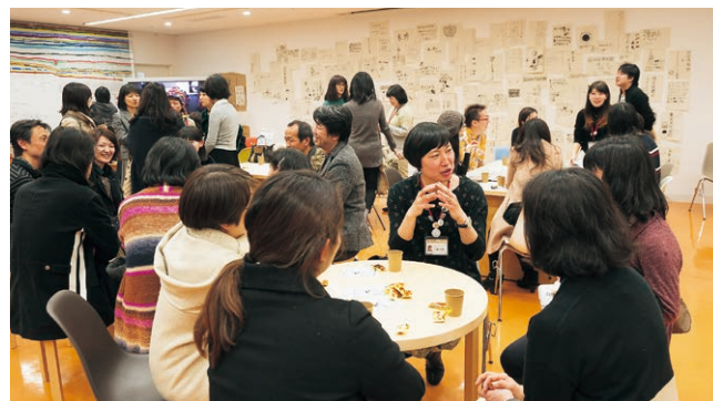
とびらプロジェクトフォーラム(第2部)