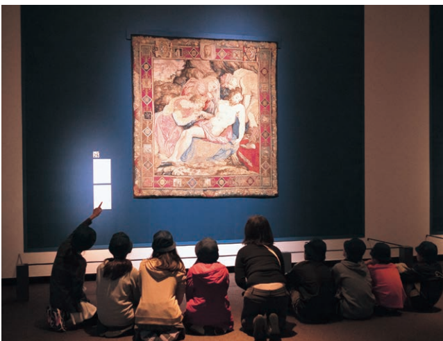
スペシャル・マンデー・コース

当館で開催される特別展の休室日(月曜日)に、学校単位で授業として来館する子どもたちのために展示室を特別にオープン。「事前→当日→事後」の学びをサポート。とびラーが子どもたちの声に耳を傾け、対話を通し、ゆったりとした環境で言語活動を重視した鑑賞を行うことを目的とした。また、希望する学校には貸切りバスが当館と学校を直行で結び、アクセスのハードルを解消した。