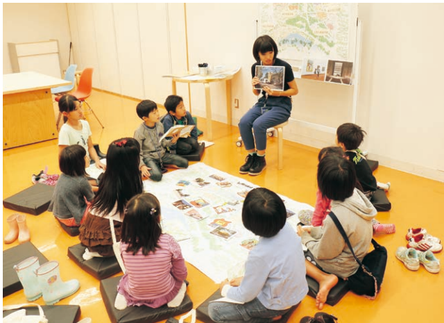
あいうえの日和(東京都美術館)

より楽しくミュージアムを巡り、学ぶための冒険のツールとして「あいうえの学校」に参加した子どもたちに、ミュージアム・スタート・パックをもれなくプレゼントしている。パックは「ビビハドトガダブック」と「肩掛けパック」がセットになったもの。「あいうえの学校」に参加していなくても、興味がある子どもには使い方の説明を行った上で配付。配付会「あいうえの日和」は連携各館でも開催し、全45回開催し、のべ528人の子どもたちの手に渡った。また、あいうえの学校に参加し、パックを受け取った子どもと合わせると、平成26年度は2,472パックが子どもたちの手に渡った。