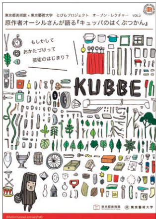
とびらプロジェクトオープン・レクチャー (チラシ)