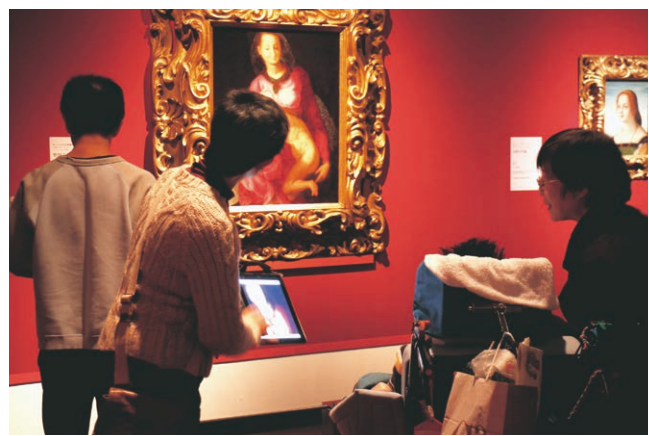
iPadの活用による鑑賞サポート

加えて、3年目ゼミに参加しているとびラーの発案により、「見えない人と見る建築ツアー」が開催された。見えない人にも、当館の建築をどう伝えるかについて、ミーティングを重ね、ツアーの補助ツールとして、建物の配置がわかる「触れる配置模型」を作成。「新印象派—光と色のドラマ」展の特別鑑賞会と同日に開催。22人が参加した。