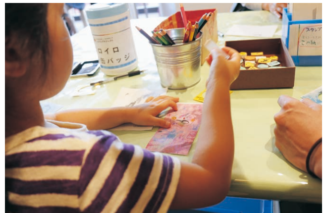
イロイロとび缶バッジ(パルテュス展・とびラボ発展展覧会関連プログラム)