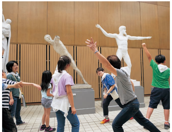
あいうえのものがたり(東京藝術大学大石膏室)

全4回／参加者数46人 対象／小学4年生～中学3年生 上野公園に集まるミュージアムへ冒険に出かけるプログラム。ミュージアムで大切にされている作品を学芸員ととびら、他の参加者と一緒にじっくり見て、たくさんの発見を促し、冒険の記録「あいうえのものがたり」を作成。冒険先は東京国立博物館総合文化展本館、国立西洋美術館常設展、国立科学博物館常設展、東京藝術大学大石膏室。