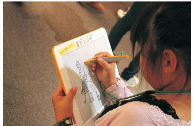
とびらボードの貸し出し(ファミリー・プログラム)