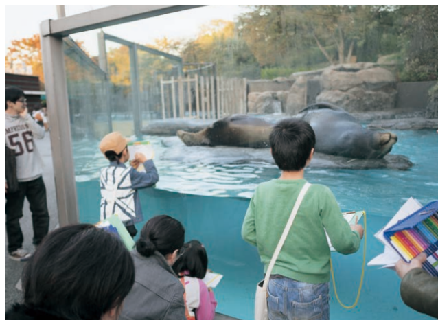
放課後のミュージアム(恩賜上野動物園)

水曜日の午後、当館の一室を子どもたちのために開室。メンバー登録制で、クラブ活動のように自由に美術館に通い、美術館が様々な人との出会いの場、学びの場、そして居場所となるような環境を目指した。展覧会を鑑賞したり、廃材で何かをつくったり、そこに集まった人と話をしたり、上野公園の他のミュージアムに出かけたり。何をするかを、その場にいる美術館学芸員やとびラーなどの大人たちと共に考え、場をつくっていくことを試みた。記録映像制作。