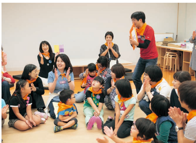
のびのびゆったりワークショップ