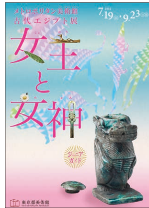
メトロポリタン美術館 古代エジプト展 ジュニアガイド