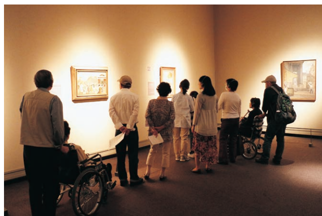
障害のある方のための特別鑑賞会

とびらプロジェクトと連動し、毎回30人程度のとびラーが当日の運営に関わり、プログラムを実現している。展覧会担当学芸員による展覧会解説(手話通訳付き)も企画棟ホワイエ(ロビー階)で行われた。また、とびラーの発案により、弱視の方が作品を拡大して見るができるよう、あらかじめiPadに複数の作品画像をダウンロードして、手元で見られるように展示会場に持参した。