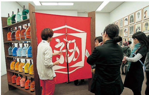
藝大卒展さんぽ(とびらボ発プログラム)