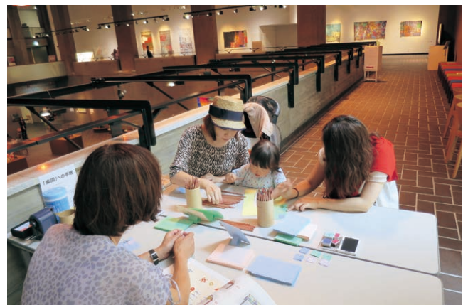
楽園への手紙(楽園としての芸術展・とびラボ発展展覧会関連プログラム)