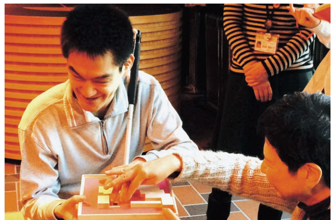
見えない人と見る建築ツアー