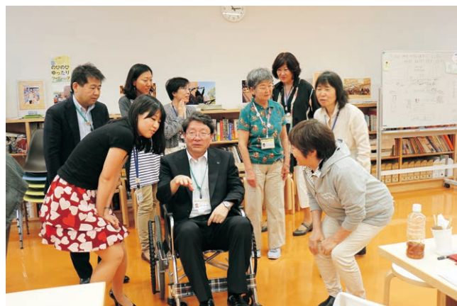
特別鑑賞会事前研修