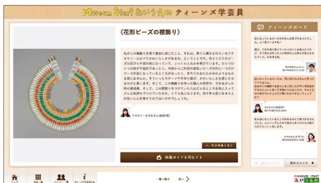
「Museum Start あいうえの『ティーンズ学芸員』」コメント画面