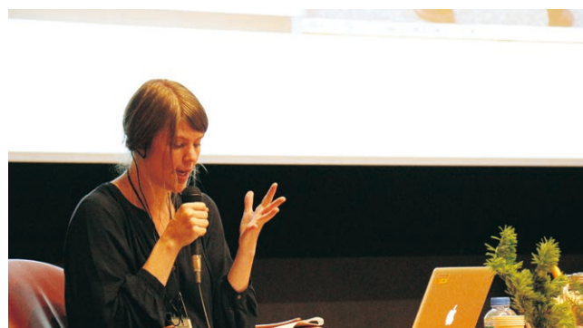
とびらプロジェクトオープン・レクチャー(オーシル・カンスタ・ヨンセン氏)

とびらボードでGO!、紙芝居プロジェクト、とびリア、トビカン・ヤカン・カイカン・ツアー、缶バッジプロジェクト、見学会、ヨリミチビジュツカン、楽園への手紙、卒展さんぽ、など。