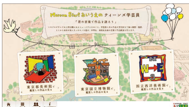
Museum Start あいうえの『ティーンズ学芸員』トップ画面