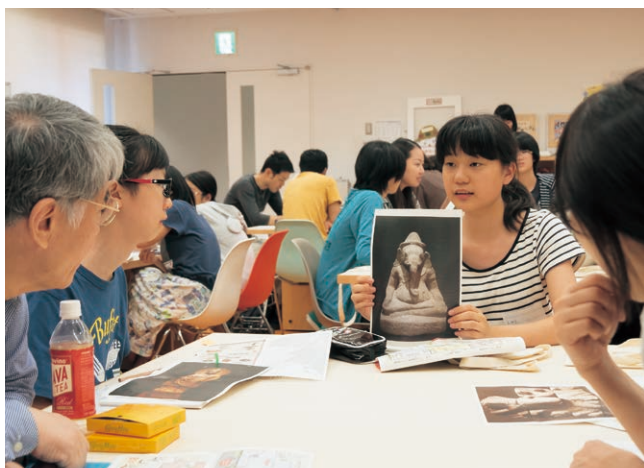
ティーンズ学芸員

上野公園にあるミュージアムをめぐり、学芸員と共に作品や文化財を丁寧に観察鑑賞し、そこから自分が気に入ったものを選び、自分の言葉で作品解説を作る長期連続プログラム。夏休み期間に5回、冬休み期間に3回、春休み期