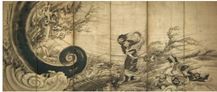
曾我蕭白《風仙図屏風》 江戸時代、1764年(宝暦14年/明和元年)頃 六曲一隻、紙本墨画 Fenollosa-Weld Collection, 11.4510