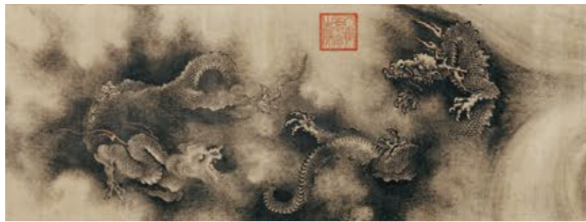
清の皇帝も愛した龍図。 陳容《九龍図巻》(部分) 南宋、1244年(淳祐4年) 一卷、紙本墨画淡彩 Francis Gardner Curtis Fund, 17.1697

世界屈指の美の殿堂、ボストン美術館の主要部門から選りすぐった珠玉の80点を紹介します。古代エジプト美術、中国美術、日本美術、フランス絵画、アメリカ絵画、版画・写真、現代美術と、古今東西の至宝が一堂に集います。同館は国や州の財政的援助を受けずにコレクションの拡充を続け、現在では約50万点の作品を所蔵しています。本展はこの素晴らしいコレクションの形成に寄与したコレクターやスポンサーの活動にも光を当てます。