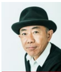
木梨憲武 1962年東京生まれ、タレントとして活躍する一方で、アパリエを持ち、作家としても活動。94年、香椎の企画をきっかけにアート作品の制作を始め、以後精力的に制作を続けていた。日本各地の美術館やNYでも展覧を開催。

テレビでおなじみの木梨憲武さんに展覧会を応援して頂くことが決定しました! CMや特別番組に出演する予定です。詳しくは公式サイトで。