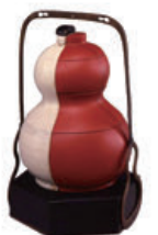
《白陶朱漆組合せ瓢成り弁当》 個人蔵