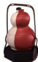
《白陶朱漆組合せ瓢成り弁当》 個人蔵