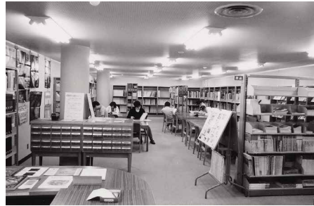
東京都美術館 美術図書室内観（1976～84年撮影）

Tokyo Metropolitan Art Museum, library interior view (photographed in 1976-84)