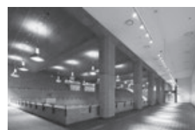
ギャラリーC 高天井部