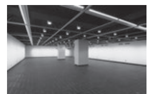
ギャラリーC 低天井部