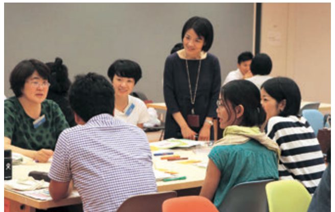
ティーチャーズ・デイ

また、研修協力として、全国私立小学校図画工作教員夏季研修会や、中堅教諭等資質向上研修、高等学校5年経験者研修を受け入れた。