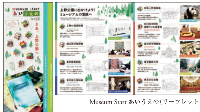
Museum Start あいうえの(リーフレット)

藝大担当者は、伊藤達矢(美術学部特任准教授、Museum Start あいうえのプロジェクト・マネージャ)、鈴木智香子(美術学部特任助手、Museum Start あいうえのプログラム・オフィサー)、長尾朋子特任助手(美術学部特任助手、Museum Start あいうえのプログラム・オフィサー、～4月)、山崎日希(藝大美術学部特任助手、Museum Start あいうえのプログラム・オフィサー、5月～)。当館のプロジェクトルームを拠点に活動した。都美担当者は、稲庭彩和子、熊谷香寿美。専門家委託として渡邊祐子(Museum Start あいうえのプログラム・オフィサー)。