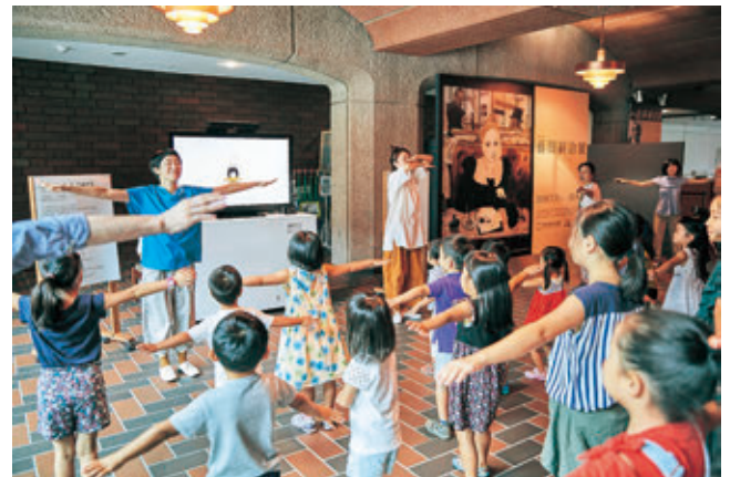
特別プログラム1：うたっておどろう！おべんとう