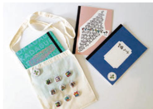
ミュージアム・スタート・パック

「ミュージアム・スタート・パック」とは、子供たちがミュージアムを楽しく活用するためのスターター・キットである。「あいうえの」のプログラムに初めて参加した子供たち全員にプレゼントしている。連携各館を紹介する「ガイドブック(ビビハドトカダブック)」とミュージアムでの体験の記録を書き込める「冒険ノート」の2冊がバインダーにまとめられている。バインダーには「あいうえの」の秘密の呪文(館種を表す言葉の頭文字をつないだ「ビビハドトカダブ」)がホログラムをあしらってデザインされている。子供たちの意欲をより高めるため、連携各館にパックを持って出かけるとオリジナルバッジを集められる仕組みとなっている。保護者向けには「あいうえの」を紹介した小冊子を配布。