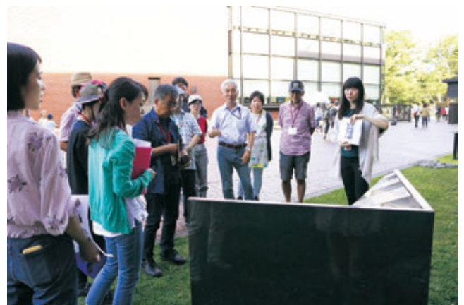
とびラボ「野外彫刻を愛でる会」

※個々の活動の詳細については、事業実績ページ(pp.55-58)及びとびらプロジェクトウェブサイトのブログページを参照のこと。 https://tobira-project.info/blog/