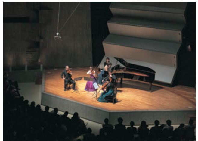
会場風景