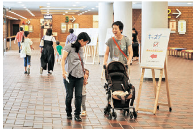
特別プログラム2：ベビーと一緒にミュージアム