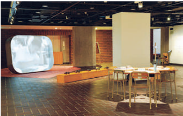
会場風景