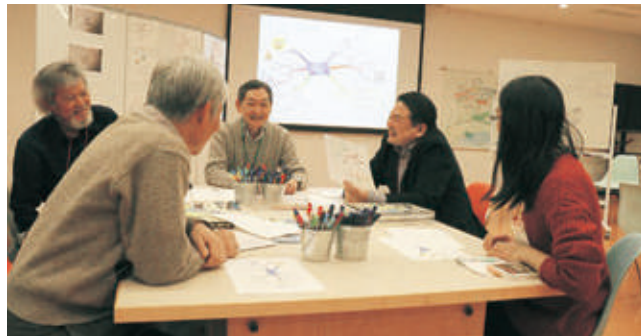
とびラボ発プログラム マインドマップで読み解く「奇想の系譜」

とびラーの発案により、様々なプログラムが開催された。詳細はp.45を参照のこと。