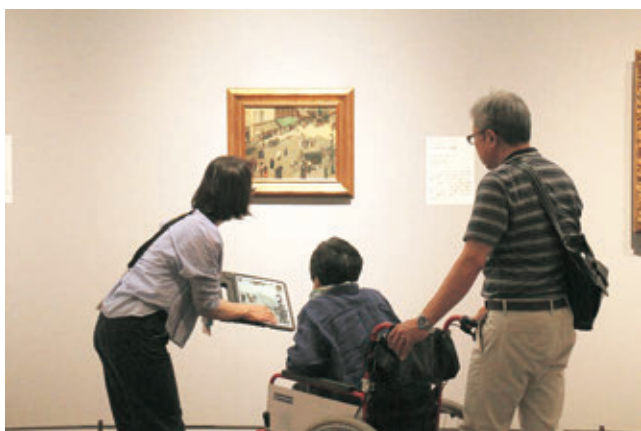
「プーシキン美術館展」(2018年) 会場風景

※各日とも開催時間は10:00～16:00(受付終了時刻は15:00)、受付時間は10:00～と12:30～の2部制