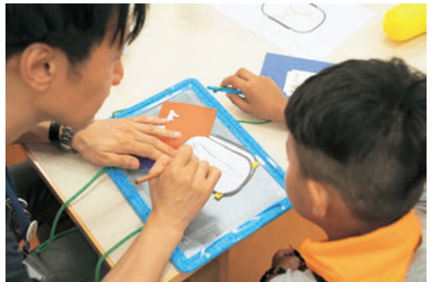
ミュージアム・トリップ

家庭等の状況により、ミュージアムを利用しにくい子供たちと、その保護者をミュージアムに招待するオーダーメイドのプログラム。対象は、児童養護施設やファミリーホーム、経済的に困難な家庭を支援している団体や外国にルーツを持ちカルチャー・ギャップなどの困難を抱える子供を支援している団体。とびラーや学芸員、大学の教員が参加者に寄り添い、初めてでも安心してミュージアムを楽しめるようプログラムを組み立てた。本年度は次の団体と連携してプログラムを実施した。NPO法人キッズドア、NPO法人多文化共生センター東京、東京養育家庭の会 3回開催/参加者数54人(こども+保護者・引率者数)