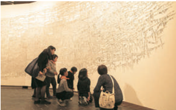
うえの!ふしぎ発見「墨部」(上野アーティストプロジェクト2018「見る、知る、感じる——現代の書」)