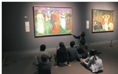
スペシャル・マンデー・コース(「ムンク展—共鳴する魂の叫び」)

特別展・企画展の休室日(月曜日)にゆったりとした会場で鑑賞授業を行うプログラム。伴走役のとびラーが子供たちの作品鑑賞をサポートする。学校から美術館までの往復バスを無料で用意し、美術館を活用しやすい環境を整えている。全4回開催／参加12校、参加者数702人(児童・生徒数)対象／都内幼保・小・中・高等・特別支援学校(幼稚園保育園は年長クラスから受入、特別支援学級も受入)