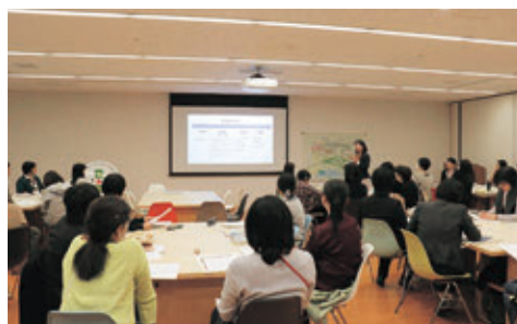
ティーチャーズ・カフェ