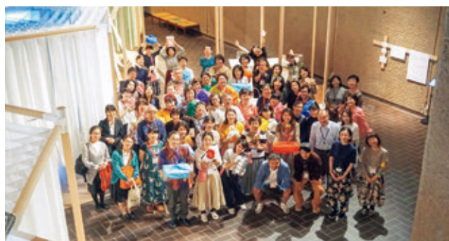
展覧会ファシリテーター「フロシキー」

昨年同様、財団連携事業である「TURNフェス4」(詳細はp.33)において、訪れた人がその人らしく過ごすことのできる場づくりを担う「TURNサポーター」として、とびラーと開扉後のアート・コミュニケーターのべ30人が活躍した。また、企画展「BENTO おべんとう展—食べる・集う・つながるデザイン」(詳細はpp.22-23)においても、展覧会ファシリテーター「フロシキー」として、多くのとびラーとアート・コミュニケーターが参加した。開幕前の事前研修や会場研修を経て、のべ527人が参加。来場者の会場での作品との出会いや体験をよりよいものにする活動を行った。登録者135人の半数がとびラーと任期満了後のアート・コミュニケーターであり、残り半数の今回初めてAC事業に関わった一般の方々との実践を通じた学び合いが行われていた。なお、ファシリテーター運営は一般社団法人アプリシエイトアプローチが担ったが、中心メンバーは任期満了後のアート・コミュニケーターであり、今までに蓄積された経験が多くの「フロシキー」に共有された。