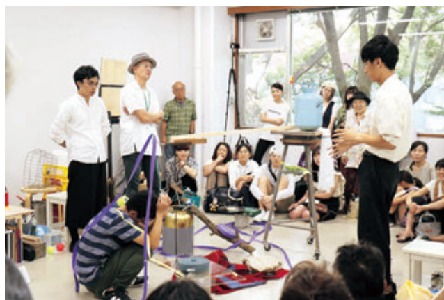
これからゼミ 藝祭「おく？」ワークショップ編

上記のような活動を経て、2019(平成31)年3月には3年の任期を満了したとびラーのための「開扉会(かいびかい)」を開催した。本年度任期満了した5期とびラー 39人。