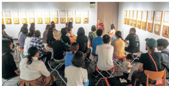
出品作家によるプログラム

「BENTO おべんとう展—食べる・集う・つながるデザイン」の関連プログラムとして出品作家6人とワークショップを行った(詳細はpp.22-23を参照)。また、高校生以下の子供とその保護者を対象とする「キッズデー」(詳細はp.53)を企画展で初めて開催し、保護者の観覧料も無料とした。休館日の開催であったが、レストランやショップとも連携し、全館で子供たちを迎えた。