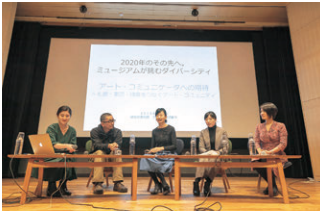
とびらプロジェクトフォーラム

第2部はとびラーの活動拠点であるアートスタディールームを会場に「オープンスペース・カフェ」を開催し「とびらプロジェクト」の活動拠点を公開。参加者同士がフランクに対話できるカフェや、普段の活動を知ってもらうための資料を用意し、とびラーが来場者の率直な疑問にも対応した。