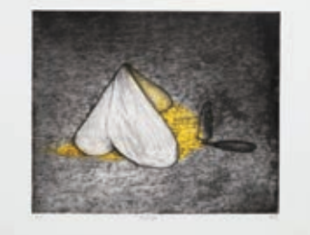
< Refuge > 2021年