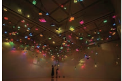
< Caos poetico / 詩的な混沌 > 2019年