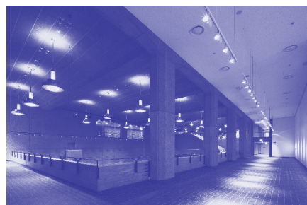
ギャラリー C 高天井部