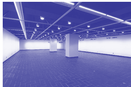
ギャラリー C 低天井部