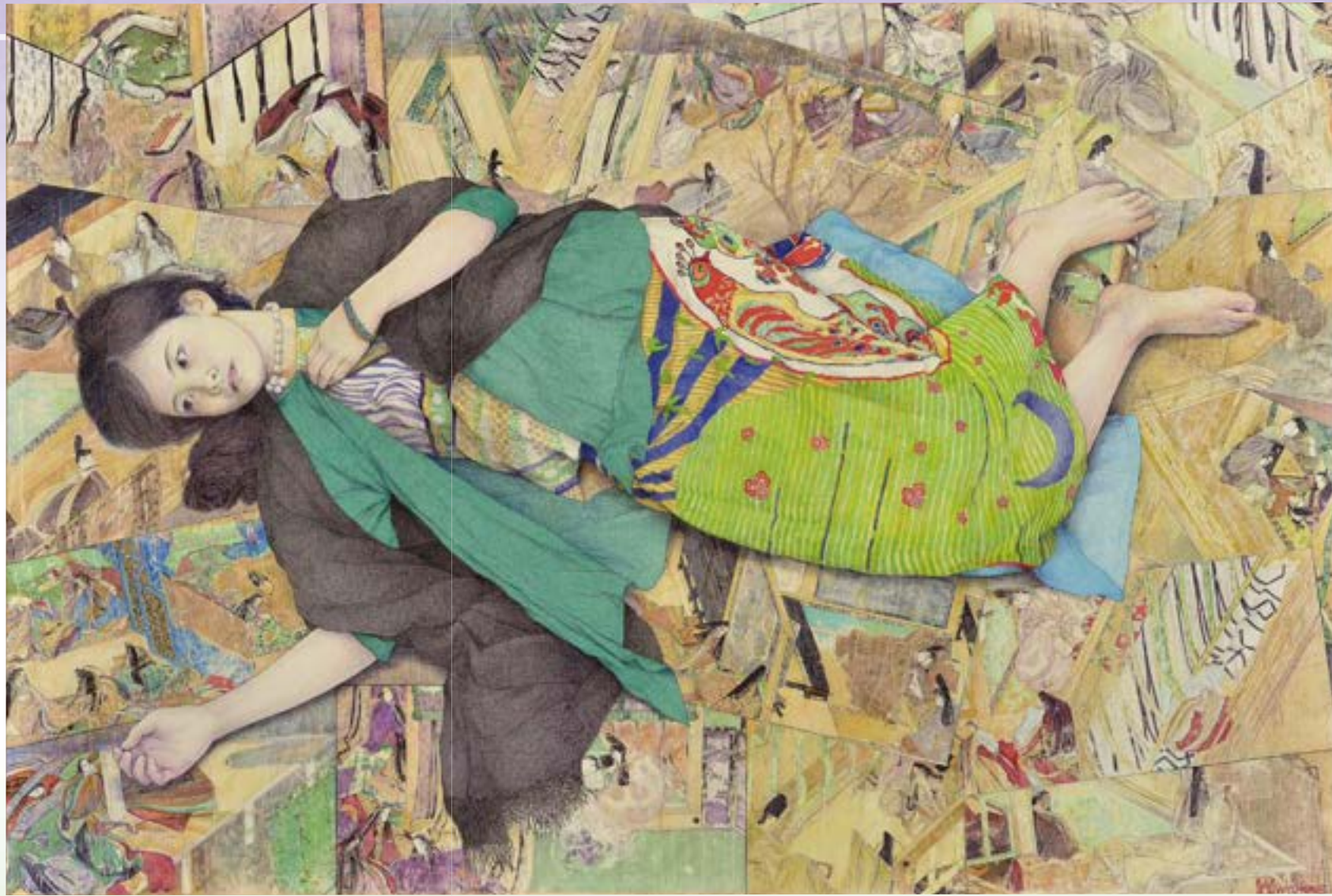
渡邊裕公《千年之恋～源氏物語～》2016年 作家蔵

絵の中に横たわる女の人。その下にはたくさんのカードが散りばめられているように見えます。画家の渡邊裕公さんはこの背景を描くために、12世紀前半に生まれた『源氏物語』を絵画にした《源氏物語絵巻》を忠実に写生し、バラバラに配置しました。『源氏物語』のいろいろな場面が、心地よく、リズムカルに重なり合っています。絵のつながり方から、たくさんの形が見えてきます。