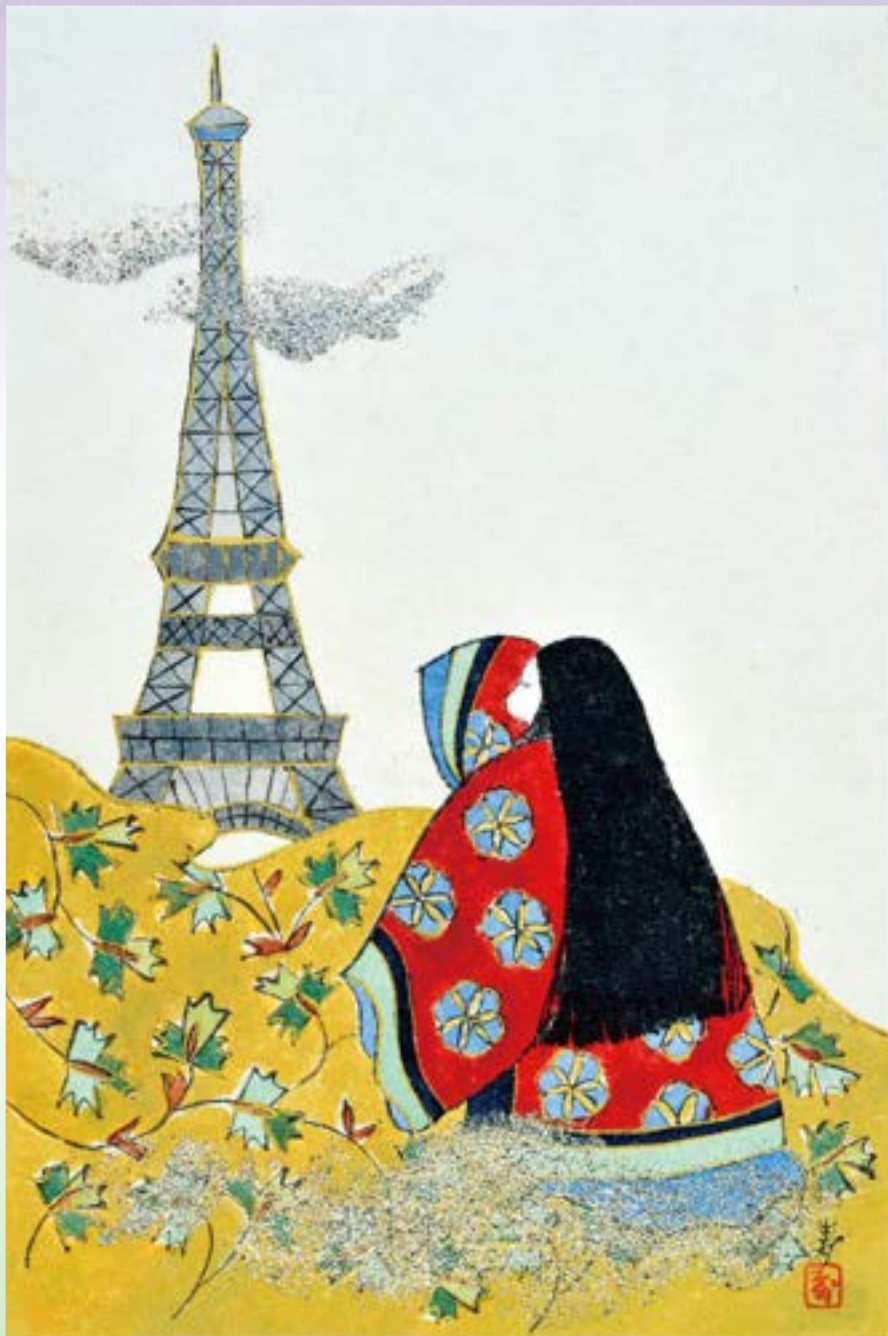
青木寿恵《パリの若紫》制作年不詳 寿恵更紗ミュージアム蔵