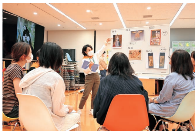
「聴く/見る/話す 鑑賞を深く味わおう」