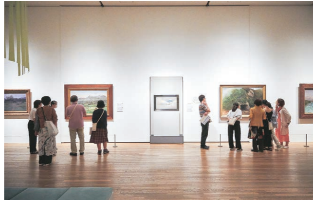
東京藝術大学大学美術館での作品鑑賞の様子 「日本美術をひも解くー皇室、美の玉手箱」展、東京藝術大学大学美術館