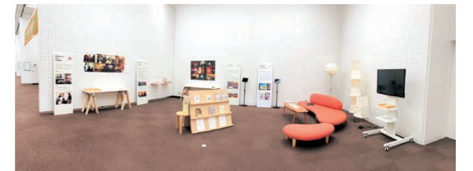
「アート・コミュニケーション事業におけるソーシャルデザインの活動」、東京都美術館展示ブース

2022年6月28日～7月7日に開催された国際カンファレンス「だれもが文化でつながる国際会議」が、東京国立博物館と東京都美術館を主な会場に行われた。本会議のテーマと並行し開催された分科会は、アートスタディールームを会場に、国内の文化施設や中間組織等の実践者やアーティストによる活動報告を中心に、今後の展望をディスカッションし、各セッションテーマにおける芸術文化領域でのアクションと未来に向けた展望を共有した。また、公募棟ロビー階第1展示室では展示会が行われ、アジア域内の3つの文化施設・組織の活動を紹介した「アーカイブ展示」の中で、アート・コミュニケーション事業における社会課題に対応した取組みの紹介展示を行った。