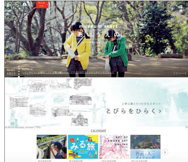
ウェブサイトトップページ

「あいうえの」ウェブサイトでは、特徴的なコンテンツとして、連携9館の豊富な参加型プログラムや展覧会情報等を一望できる「ミュージアム・カレンダー機能」や、参加者による「冒険ノート」の「投稿フォーム機能」、施設のみどころやそこで働く人々のミュージアム体験に関するインタビュー記事等を掲載した「連携各館紹介ページ」を運用している。また、各プログラムの実施報告として「活動ブログ」を掲載。なお、「冒険ノート」はInstagramの「あいうえの」公式アカウントでも順次公開している。