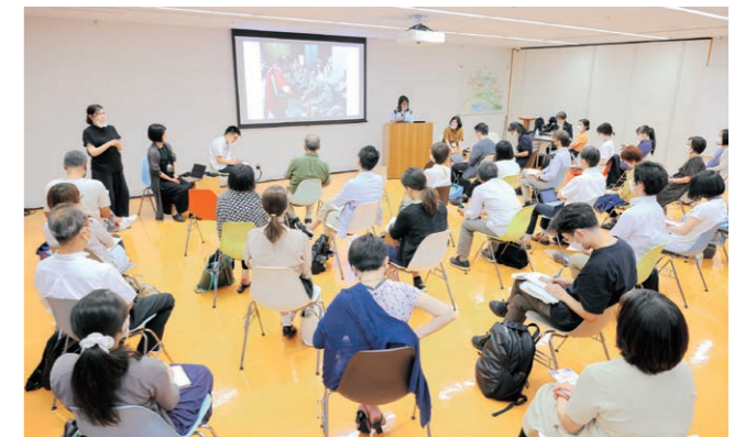
「だれもが文化でつながる国際会議」分科会セッション1 発表の様子