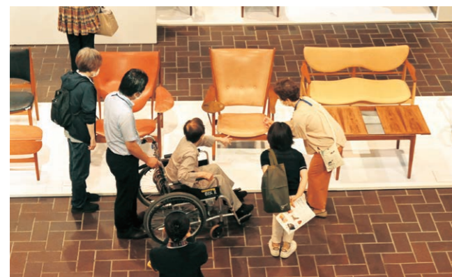
オレンジカフェの様子 「フィン・ユールとデンマークの椅子」、東京都美術館