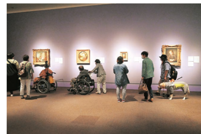
障害のある方のための特別鑑賞会「スコットランド国立美術館 THE GREATS 美の巨匠たち」、東京都美術館