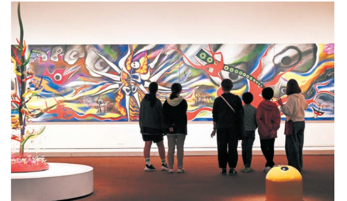
スペシャル・マンデー(品川区立城南小学校) 「展覧会 岡本太郎」、東京都美術館

言語活動を通じて子供たちの「主体性」「生きる力」を育む。図工・美術に限らず総合学習や国語など授業のねらいにあわせて実施。都美の学芸員や藝大教員が学校教員の相談に応じ、美術館を活用した授業づくりをコーディネートしている。当日だけでなく事前授業から事後授業まで教員をサポート。事前授業に活用できる作品のアートカード等が入った「鑑賞ボックス」も貸し出している。