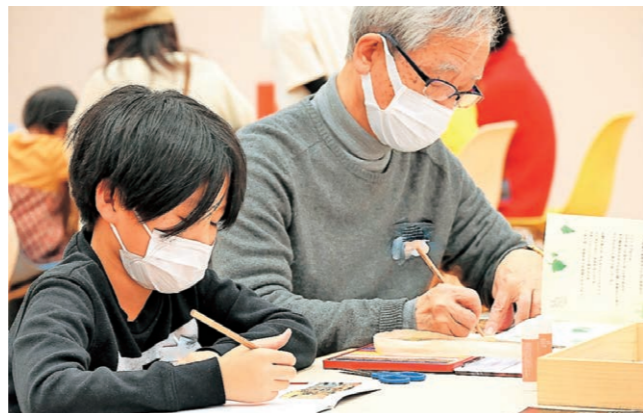
ステップ2 冒険ノート作りの様子