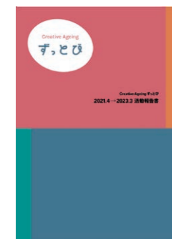
【Creative Ageing ずっとび 2021.4→2023.3 報告書報告書】

2021年度から始まった「Creative Ageing ずっとび」の2年間の取組みをまとめた冊子『Creative Ageing ずっとび 2021.4→2023.3 報告書報告書』を発行。プログラムの活動写真や参加者の声、また活動を共にしたとびラーや医療・福祉関係者からのコメント等を掲載した。