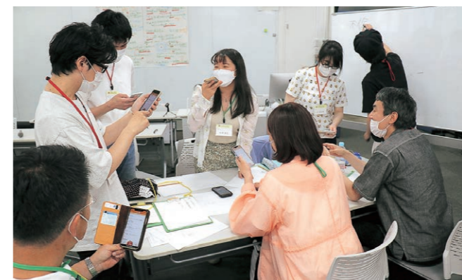
基礎講座(第5回)グッド・ミーティングについて学ぶ

とびラーは、当館のミッションや藝大からのメッセージをもとに、とびらプロジェクトの目指す方向性を共有し、1年目とびラー全員必修の「基礎講座」でとびラーとしての基本的なコミュニケーションのあり方を学ぶ。その後、より実践的な活動場面を想定した選択制の「実践講座」で活動への理解を深める。コロナ禍が続く本年度は、基礎講座は対面にて行い、7月から始まる実践講座ではウェブ会議システム(Zoom)を活用したオンラインとリアル両方で学びを深めることを目指した。