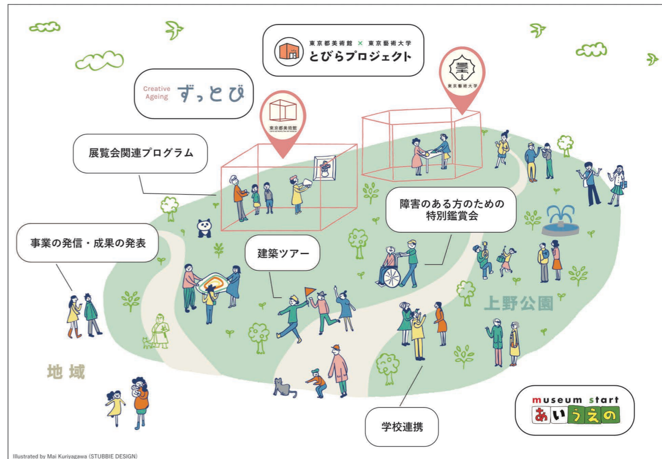
Illustrated by Mai Kuriyagawa (STUBBIE DESIGN)