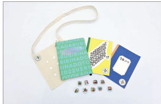
ミュージアム・スタート・バック(ver.9、2022年度版)

子供たちの意欲をより高めるため、連携各館にバックを持って出かけるとオリジナルバッジを集められる仕組みとなっている。保護者・教員には「あいうえの」を紹介した小冊子「ミュージアム・スタート・バック活用ガイドブック」を配布。