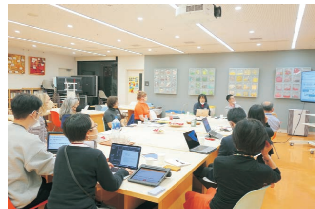
マンチェスター・カメラータとの意見交換会