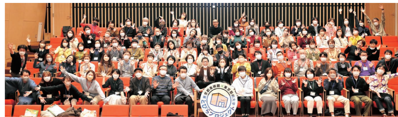
「とびらステーション」での集合写真

上記のような活動を経て、2023(令和5)年3月には3年の任期を満了したとびラーのための「開扉会(かいびかい)」が開催された。本年度は、三密を避けるため講堂とオンライン配信を組み合わせて実施した。任期満了した9期とびラー42人。