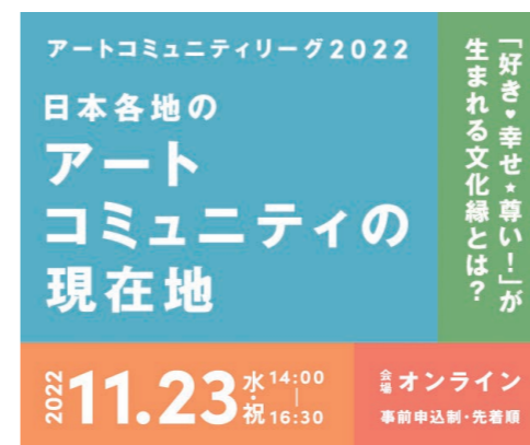
オープン・レクチャー Vol.13 の Web パナー