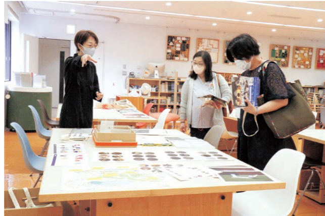
ティーチャーズ・デイ

また、研修協力として、千葉県我孫子市立教育研究会図工美術部門、新宿区立小学校教育研究会図画工作科研修会、台東区図工研究部会の研修の受け入れ、東京都公立学校中堅教諭等資質向上研修Iの受け入れを行った。