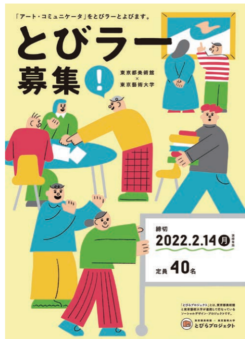
11期とびラー募集チラシ

ウェブサイト https://tobira-project.info (ページビュー/232,050)