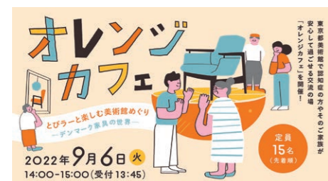
オレンジカフェのウェブ用バナー