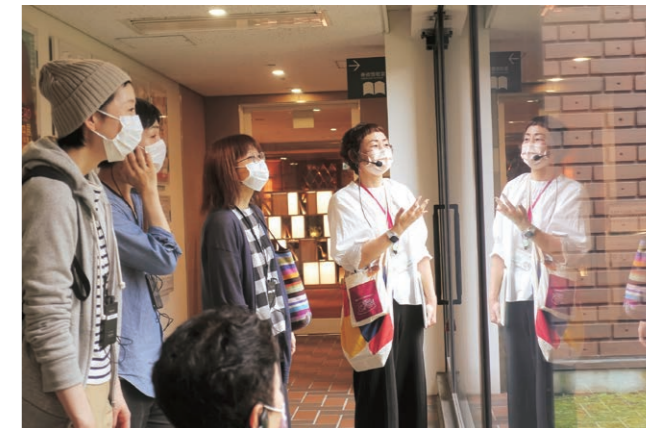
とびラーによる建築ツアーの様子

上記の定例のツアーに加え、ライトアップされた当館を散策する「トビカン・ヤカン・カイカン・ツアー」を全9回と、平日の朝に楽しめる30分間のコンパクト版建築ツアー「トビカン・モーニング・ツアー」を全5回行った。