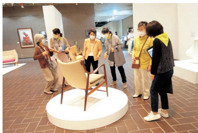
「暮らしの彩り おとな美術館」、「フィン・ユールとデンマークの椅子」、東京都美術館