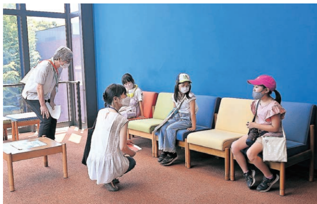
SDGsで探究！名建築をみる

・うへの！アトリサーチャー オンライン&リアル オンラインとリアルで2ステップで、アートを探究し、上野公園の文化施設を楽しむブレンディッド・ラーニング