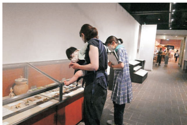
「ベビーとゆったり美術館」、「都美セレクション グループ展 2022」、東京都美術館

開扉冊子2023、作品鑑賞音声ガイドを作ろうラボ、上野公園探検隊、きこえて何だろう？、あなたの「とびらビフォーアフター」をきかせて描かせてほしいラボ、とびら575句会、消しゴムはんこラボ、えほんラボ、VTS練習会、トビカン・オンライン・フライトツアー、トビカン・スポット・ムービーラボ、とびラー10年すごろく、手話の世界を訪ねよう！、東京の生活史～とびラー版～等 ※詳細はとびらプロジェクトウェブサイトのとびらラボページを参照のこと。 https://tobira-project.info/tobilab