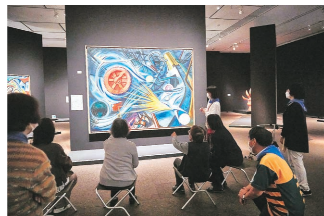
ずっとび鑑賞会の様子 「展覧会 岡本太郎」、東京都美術館