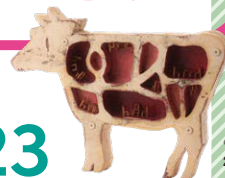
《牛レストラ》 2001年 個人蔵