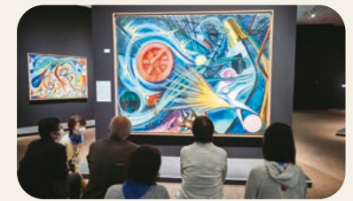
「ずっとび鑑賞会ー展覧会 岡本太郎」の様子 岡本太郎《重工業》1949年 川崎市岡本太郎美術館蔵 東京都美術館「展覧会 岡本太郎」(2022年)

Scene of "Zuttobi Art Appreciation Program - Okamoto Taro: A Retrospective" Taro Okamoto, Heavy Industry , 1949, Collection of Taro Okamoto Museum of Art, Kawasaki "Okamoto Taro: A Retrospective," Tokyo Metropolitan Art Museum (2022)