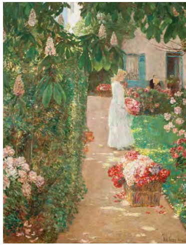
チャイルド・ハッサム《花摘み、フランス式庭園にて》 1888年 油彩、カンヴァス ウスター美術館 Theodore T. and Mary G. Ellis Collection, 1940.87