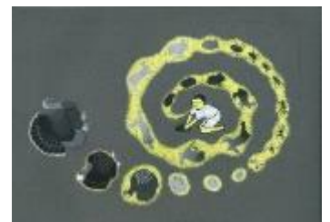
《NeNe Sol - 末っ子の太陽 -》 2011年 作家蔵 左：試作版 右：挿絵