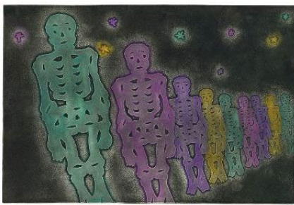
《Una marcha de los esqueletos (ガイコツの行進)》 2004年 作家蔵

90年代から国内外のグループ展や個展で作品を発表してきた荒木珠奈。本展では、初期の作品から、近作、本展のための最新作まで、約90点以上を展示します。メキシコの先住民と共同制作したマヤ神話に基づく絵本、こどもたちとのワークショップから生まれた作品をはじめ、版画、立体作品、インスタレーションなど幅広いジャンルの多様な作品を網羅する、初めての回顧展です。