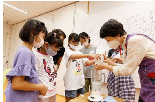
東京都美術館でのワークショップの様子 2022年