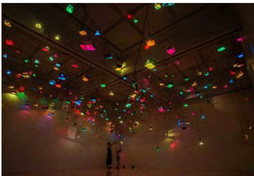
《Caos poetico (詩的な混沌)》 2005年 東京都現代美術館蔵

鑑賞者が参加することで次々と様相を変え、カラフルで幻想的な展示空間が作り出されるインスタレーションや、現実と空想が融合したような詩情あふれる版画や立体作品などにより、地下の展示室全体を1つの地下空間と見立てた、ちょっと怖くて懐かしい空間を体感できる 展示構成を試みます 。会期中は作家による 造形ワークショップ や、アート・コミュニケータとの 鑑賞プログラム などを多数開催します。