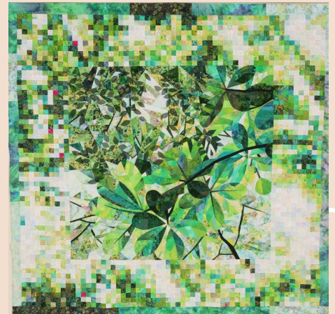
上田葉子《Light and Green III》2006年 布、糸

幼少期よりテキスタイルに興味を持ち、女子美術大学で美術を学ぶ。画家上田薫と結婚後、キルトを始め、配色、デザイン、ミシンテクニックを独自に研究。作品は、ヒーリングアートとしても使われ、医療施設などでも用いられている。国内外で作品発表、講習会の講師を務める。近年は簡単に取り組めるサステナブルなソーイングや、キルトを気軽に楽しめる教材作り、人材育成にも力を注いでいる。