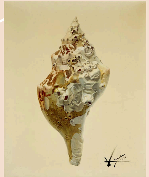
上田薫《貝殻》1970年 アクリル、カンヴァス

1954年東京藝術大学を卒業後、画家として活動を始める。1960年代後半には、なま卵やゼリーなど身近なモチーフを選び、写真を使って対象を精巧に描き出す独自の写実表現を確立する。2020年頃から心不全で入院が増え、心臓弁膜症のカテーテル手術を受ける。手術は成功したが、コロナ禍での入院などで、認知機能が衰え出す。工程の多い油彩表現が難しくなり、リハビリとして爬虫類や海の生き物などのスケッチを色鉛筆で描いている。