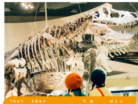
宇宙や地球のふしぎに出会える場所