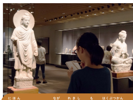
日本でもっとも長い歴史を持つ博物館

総合文化展(平常展)では国宝や重要文化財がいつでも見られるよ。日本美術が見られる本館やアジアの文化を巡る東洋館などの展示館がある!