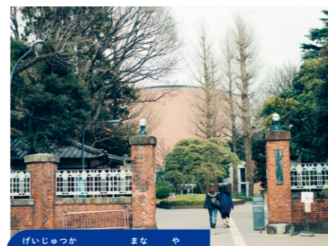
芸術家たちの学び舎