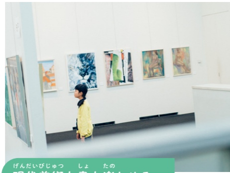
現代美術も書も楽しめる

油絵や書、マンガまで、いろいろな作品が見られるよ。公園からすぐ入れる大きなガラス戸が特徴的なギャラリーは明るく開放的な空間。