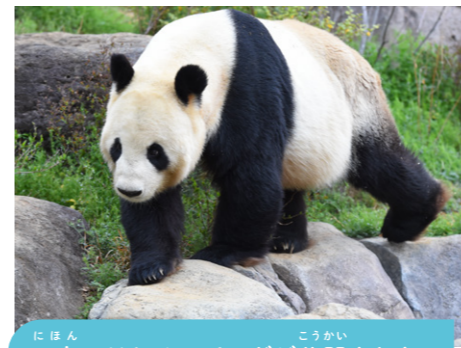
日本ではじめてパンダが公開された

日本で最初にできた動物園。緑あふれる東園と不忍池が広がる西園では世界各地の動物たちを飼育しているよ。