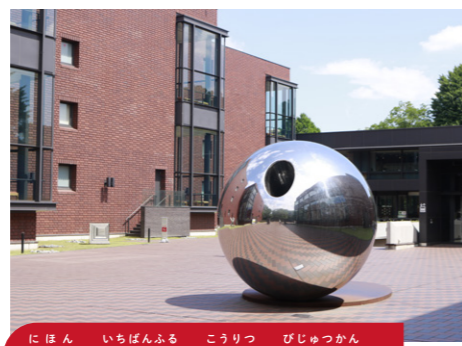
日本で一番古い公立の美術館

世界の名画に出会えたり、君の絵が飾られたりするかも?! ミュージアムの冒険をもっと楽しめるプログラムと、「とびらー」(アート・コミュニケーター)が君を待っている。