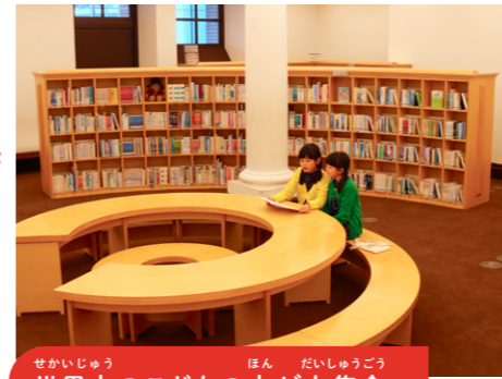
世界中のこどもの本が大集合