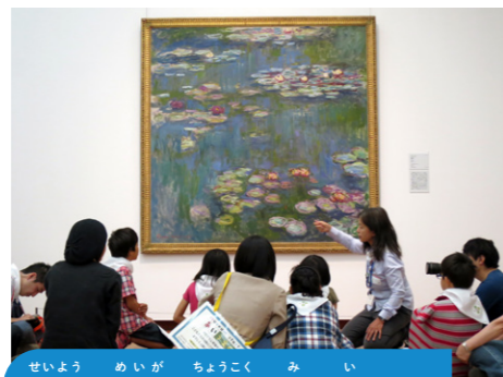
西洋の名画や彫刻を見に行こう

西洋(ヨーロッパやアメリカ)の名画や彫刻が飾られているよ。建物は建築家のル・コルビュジェが設計。2016年に世界文化遺産に登録されたんだ。