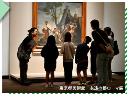
東京都美術館 永遠の都ローマ展