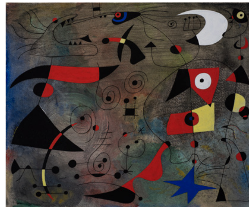
《女と鳥》 1940 グアッシュ、油彩/紙 38 x 46 cm ナーマド・コレクション Successió Miró Archive