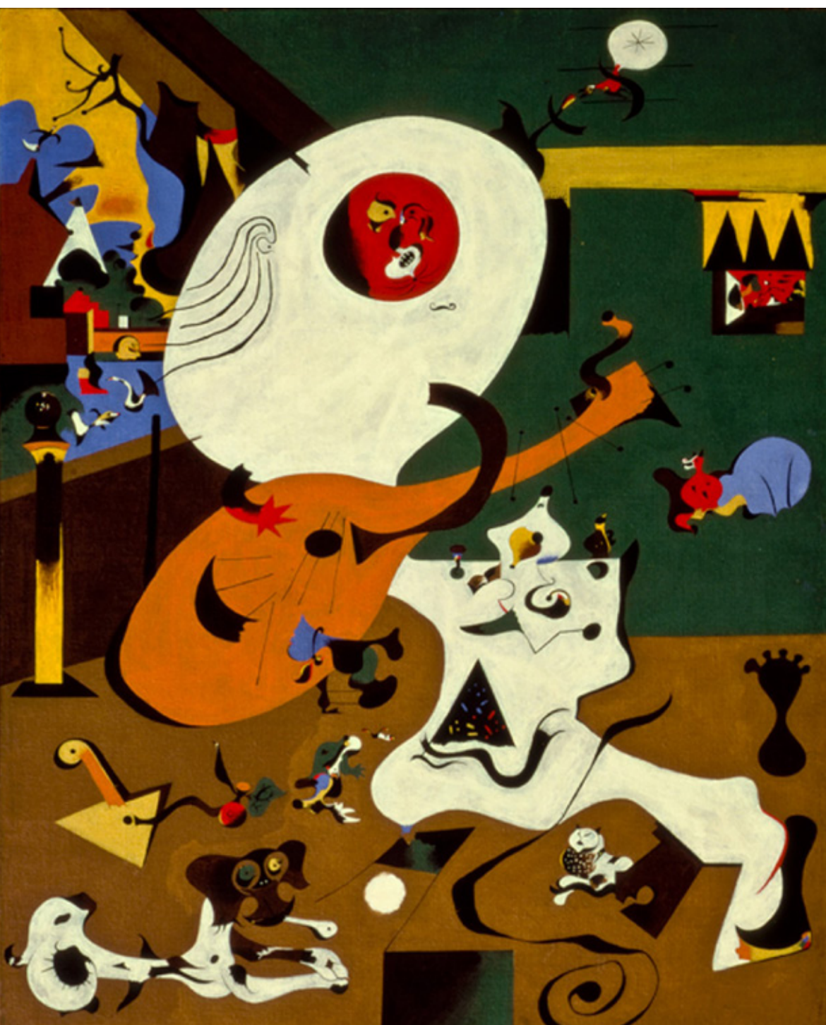
(オランダの室内) | 1928 油彩、カンワクス 91.8 x 73 cm ニューヨーク近代美術館 Mas Simon Guggenheim Fund. Acc. no. 163.1945