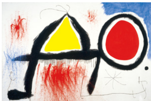
《太陽の前の人物》 1968 アクリル/カンヴァス 174 x 260 cm ジュアン・ミロ財団、 バルセロナ Fundació Joan Miró, Barcelona.