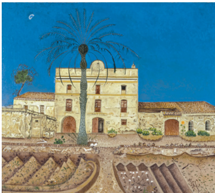
《ヤシの木のある家》 1918 油彩/カンヴァス65 x 73 cm 国立ソフィア王妃芸術センター、マドリッド Successió Miró Archive