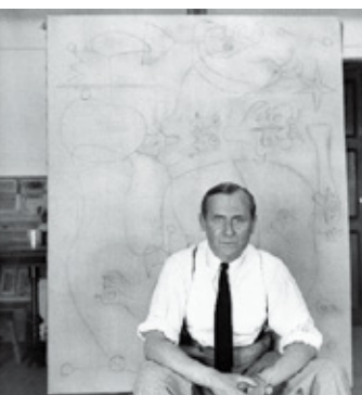
Portrait of Joan Miró, Passatge del Crèdit studio, 1944.

ジュアン・ミロ (1893-1983) 1893年にバルセロナで生まれる。 1920年代にシュルレアリスムの画家 として名声を得るが、それに留まらず さまざまな表現を試みた。彼の作品 には、周囲の政治的・社会的出来事 への強い感受性と反骨精神が反映さ れる。90歳で亡くなるまで、特定の 運動に属することのない純粋で普遍 的な芸術を追求し、20世紀で最も影 響力のある芸術家の一人となった。