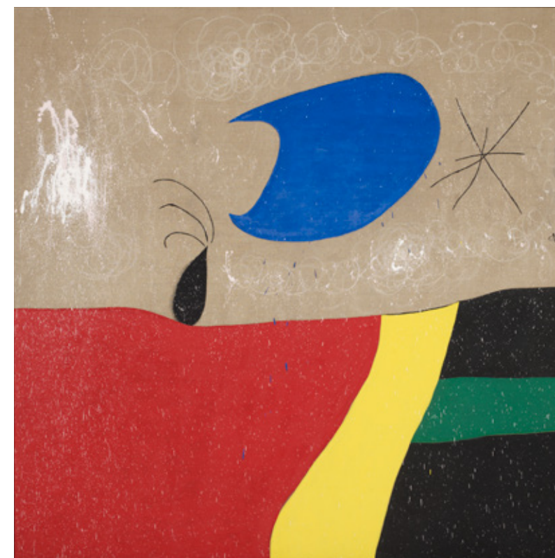
《焼かれたカンヴァス2》 1973 アクリル/カンヴァス 130 x 195 cm ジュアン・ミロ財団、バルセロナ Fundació Joan Miró, Barcelona. On loan from a private collection. Successió Miró Archive