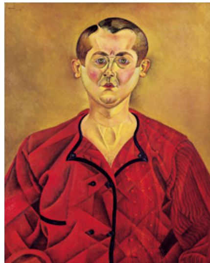
《自画像》 1919 油彩/カンヴァス 73 x 60 cm ピカソ美術館、パリ Successió Miró Archive