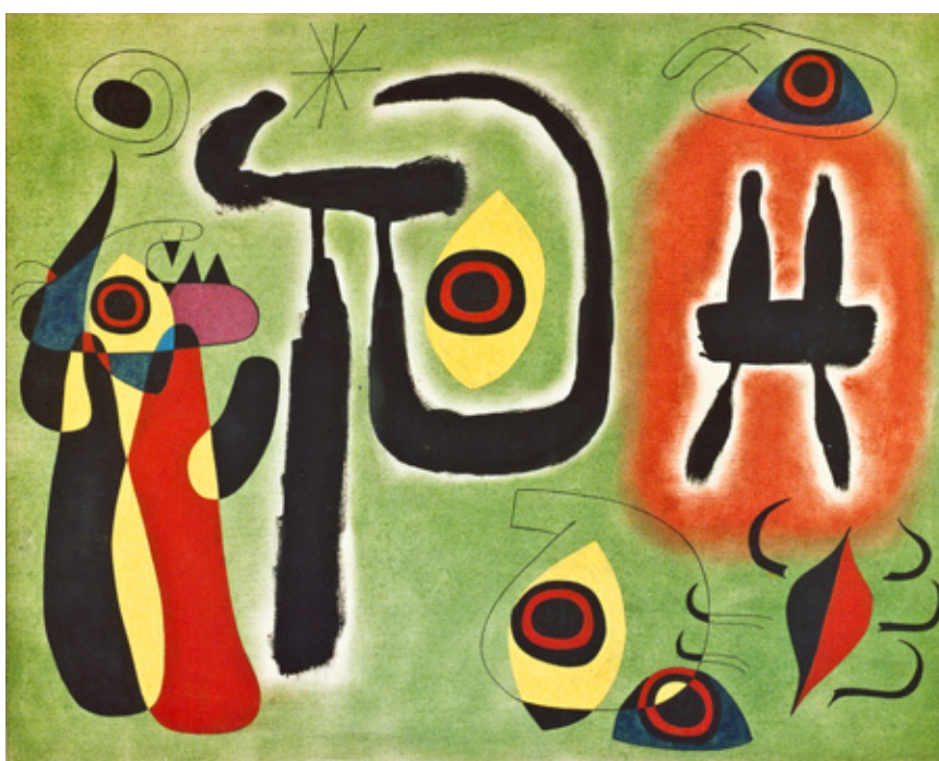
《クモを苦しめる赤い太陽》 1948 油彩/カンヴァス 76 x 96 cm ナーマド・コレクション Successió Miró Archive