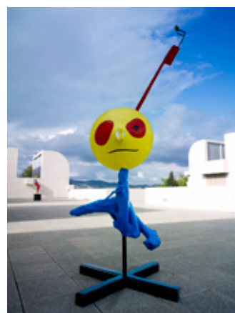
《女と鳥》 1967 着色ブロンズ 200 x 102 x 77 cm ジュアン・ミロ財団、 バルセロナ Fundació Joan Miró, Barcelona.