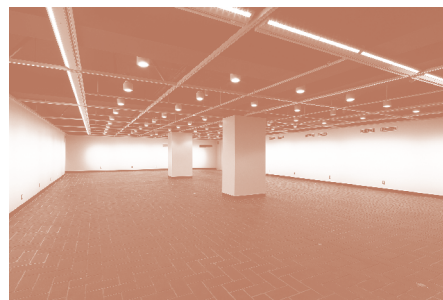
ギャラリーC 低天井部