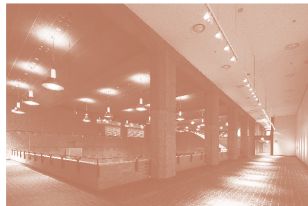
ギャラリーC 高天井部