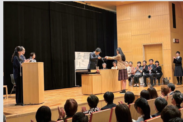
2024年10月講堂利用より (「第65回記念 日本書鏡院展 授賞式」日本書鏡院) Scenes of Auditorium in use in October 2024 (Nihonshokyojin's "65th Anniversary Nihonshokyointen Awards Ceremony")

また、別の日の交流棟ロビー階の講堂では、日本書鏡院展授賞式の準備が進められていました。一般と学生の部の受賞者のご家族の皆様、壇上には審査委員の先生方が見守っています。授賞式が始ま