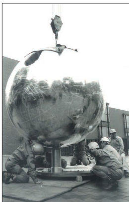
《my sky hole 85-2 光と影》設置風景 1985年