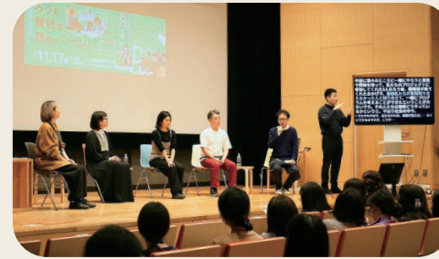
とびらプロジェクト オープン・レクチャーでの手話通訳 (右端) Sign language interpretation at a Tobira Project open lecture (far right)

報アクセシビリティ提供の一環として、2023年度よりインフォメーション(中央棟LB階)には土・日曜日に手話通訳を配していますが、2024年度からは当館主催の展覧会出品作家による講演会やギャラリートークなどには、手話通訳を配したり日本語字幕の表示をしています。手話による施設案内動画はすでに公開されていますが、当館の建築の魅力を、とびらプロジェクト *2 で活動するアート・コミュニケーター「とびラー」ならではの視点から手話で伝える動画も制作しました。こちらは近日公開予定です。