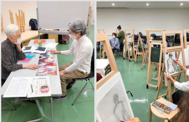
2024年10月スタジオ利用より(「人物デッサン・作品講評」女流画家協会)

Sharing the joy of creation in the Studio and Auditorium