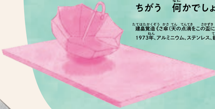
たてはたくぞう かさ てん てんてき さかづき 建畠覚造《さ傘(天の点滴をこの壺に)》 ねん 1973年、アルミニウム、ステンレス、鉄

9 かさを 持つところから 何かが 落ちています。 かさの 中に入っているのは 雨でしょうか? ちがう 何かでしょうか?