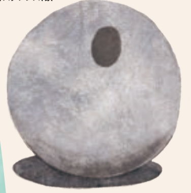
いのうえぶさち ひかりかげ 井上武吉《my sky hole 85-2 光と影》 ねん 1985年、ステンレス、鉄

2 右にあるのは ぼうしでしょうか? 石で できているのに、 やわらかそうです。