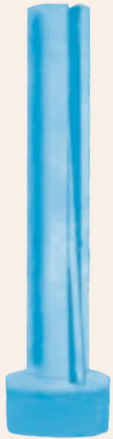
おだじょうえんちゅうりょうい 小田義《円柱の領域》 ねん 1975年、ステンレス

9 かさを 持つところから 何かが 落ちています。 かさの 中に入っているのは 雨でしょうか? ちがう 何かでしょうか?