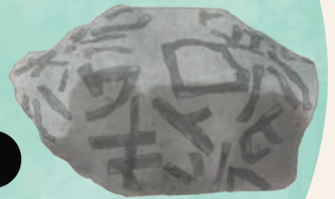
もがみひさゆき 最上壽之《イロハニホトチリヌルヲワカヨタレンソツネナラムウキ ノオクヤマケフコヘデアサキユメシエヒモセソソ》 ねん ふしおさわいし 1979年、富士大沢石