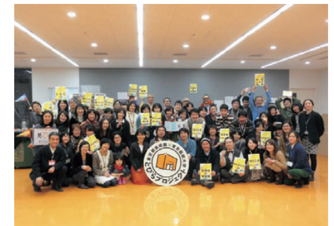
とびらプロジェクト集合写真

とびらボードでGO！、とびリア、ライぶらり、トビカンみどころマップ、紙芝居プロジェクト、と・も・に一視覚障害者編一、思わずにっこりプロジェクト、見楽会、とびの人々、企画展勉強会、缶バッジプロジェクトなど