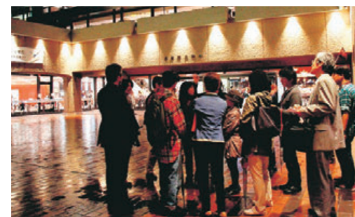
トビカン・ヤカン・カIKAN・ツアー