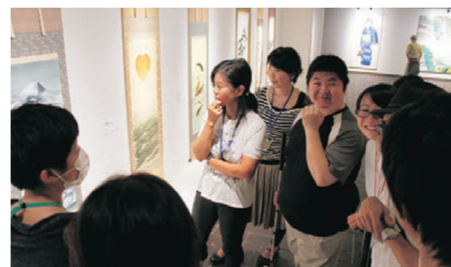
研究会風景（展示案内）