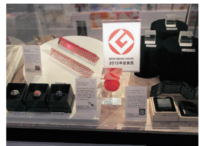
ミュージアムショップのディスプレイ