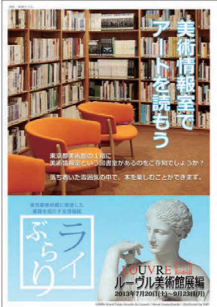
『ライぶらり』ルーヴル美術館展編