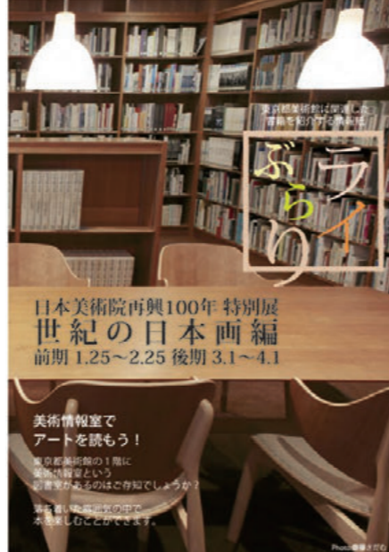
『ライぶらり』世紀の日本画編