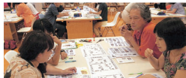
ティーチャーズ・デイ