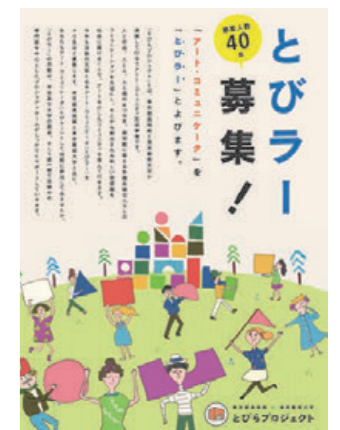
とびら募集チラシ

199 人からの応募があり、書類審査、面接を経て、55 人が第 2 期とびらに決定。約 4 倍の倍率であった。この 55 人と平成 24 年度の第 1 期とびら 72 人とで 2 年目のとびらプロジェクトが始動した。