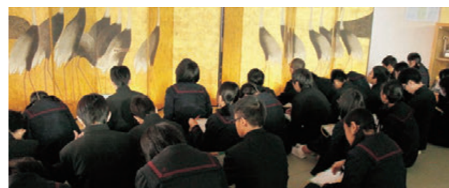
全造連の東京大会での鑑賞授業風景 墨田区立両国中学校

http://www.bunka.go.jp/bijutsukan_hakubutsukan/museum/ 全国造形教育研究大会 http://2013tokyo.zenzouren.net/