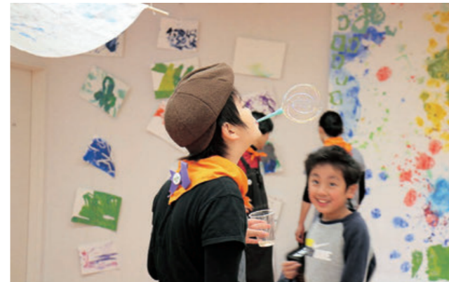
のびのびゆったりワークショップ

障害のある子供たちを含むすべての子供たちのためのアート・コース。手や体を動かしながら楽しくアートに触れる機会を創出。美術館の環境を活かし、すべての子供たちがゆったりと鑑賞し、のびのびと表現できる環境を用意。6回とも同じとびラーが参加者に寄り添い、安心して手や体を動かし、のびのび表現することができた。