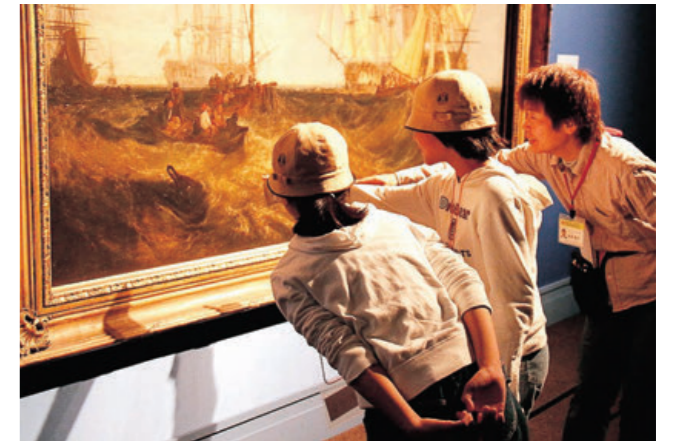
スペシャル・マンデー・コース

した。また、希望される学校には貸切りバスが当館と学校を直通で結び、アクセスのハードルを解消した。