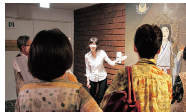
見学会（福田美蘭展）