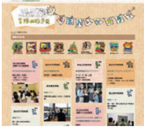
「冒険の行き先」ページ