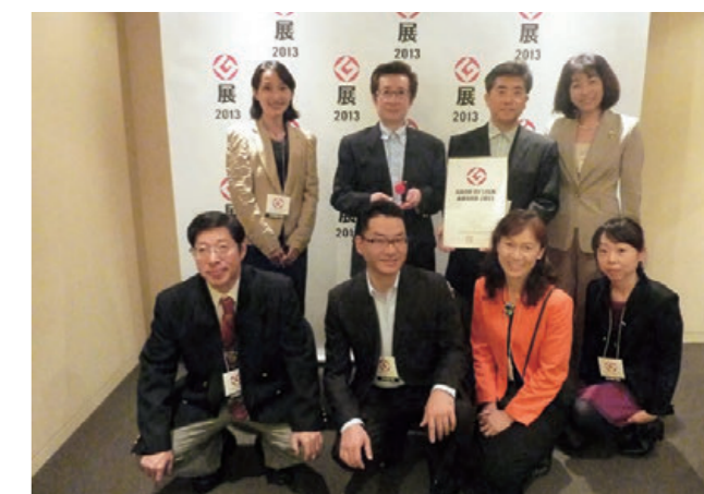
グッドデザイン賞授賞式

審査では、「美術館はアートを媒介に社会や産業の活性化を行う主体的拠点となることが新たな役割となりつつあり、このプロジェクトは美術館の新たなビジネスモデルの可能性、産業社会の中での新たな位置づけを開く試みである」と評価された。