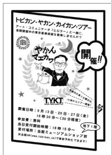
トビカン・ヤカン・カIKAN・ツアーチラシ