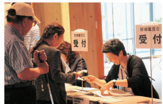
特別鑑賞会受付風景