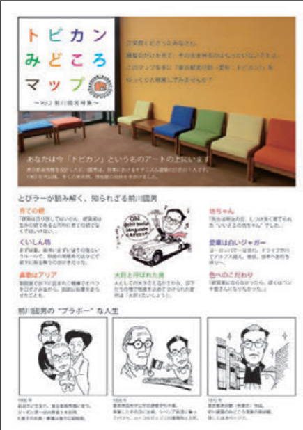
『トピカンみどころマップ』前川國男特集