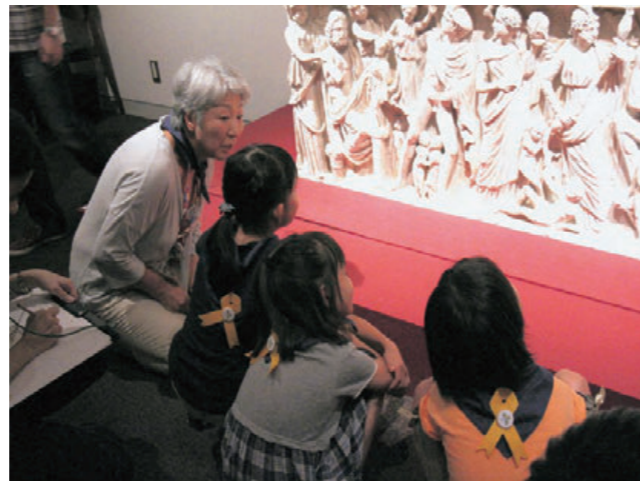
海をめぐるものがたり

特別展「ルーヴル美術館展」にちなんだ2時間のワークショップ。ルーヴル美術館が大切にしてきた作品をじっくり見ながら「海をめぐるものがたり」をテーマとして鑑賞を楽しみ、鑑賞の記憶を「ビビハドトカダブック」に記録した。