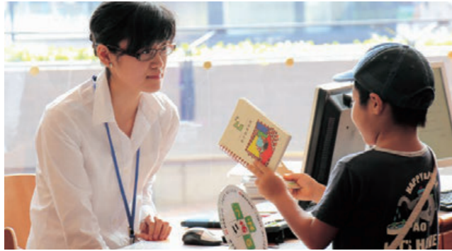
ビビハドトカダブック