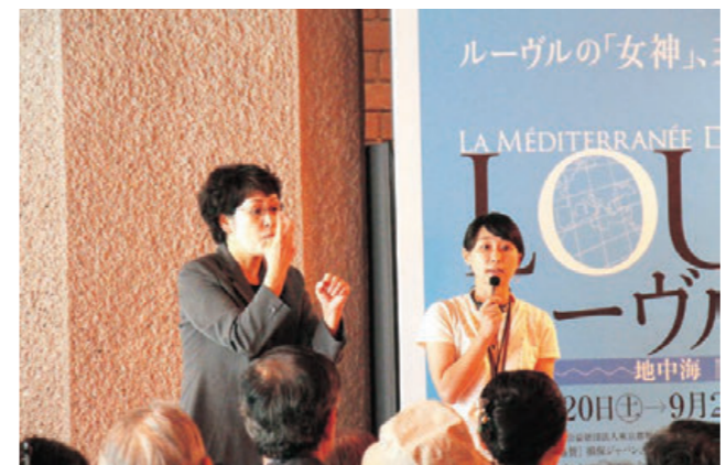
特別鑑賞会学芸員展覧会解説

加えて、世紀の日本画展の鑑賞会においては、任意団体「視覚障害者をつくる美術鑑賞ワークショップ」の協力を受け、見える人と見えない人が一緒に鑑賞する「トーク∞トーク 見える人と見えない人の鑑賞プログラム」を行った。2回開催、41人参加。