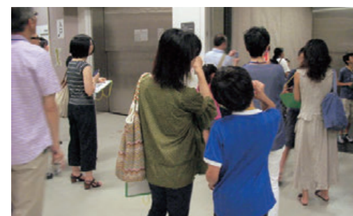
美術館たんけんツアー

「建築ツアー」は、建築家・前川國男の設計による当館の建物の魅力を知ってもらうツアー。とびラーの案内で、当館のあちこちを散策する。奇数月第3土曜日14時から開催。案内人のオリジナリティが発揮され、それぞれ独自のツアーを展開。6回開催、のべ130人参加。平成25年度は昼の開催に加え、ライトアップされた当館を散策する「トビカン・ヤカン・カIKAN・ツアー」(9.11月)「トビカン・トワイライト・ツアー」(12月)がとびラーからの発案により開催された。7回開催、のべ81人が参加。また、とびラーによって「上野の杜の宝石箱」東京都美術館ヤカン・ミドコロ・スポット」というチラシが作成・配布された。