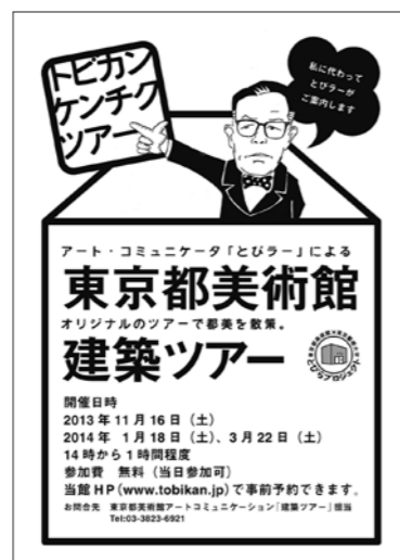
建築ツアーチラシ

建築ツアーでは平成24年から定期的に開催している奇数月のツアーに加え、とびラーからのアイデアによる「夜間ライトアップ時」のツアーを開催しました。ライトアップ時のツアーは、夜間開室のアナウンスになると共に、30分間のツアーという気軽さをウリにした内容で、昼間の参加者とは異なる属性の方に多く参加いただくことができました。参加者のほとんどは当日のアナウンスを聞いて参加してくださいましたが、満足度は高く、引き続きの開催を求める声も多くいただきました。(河野)