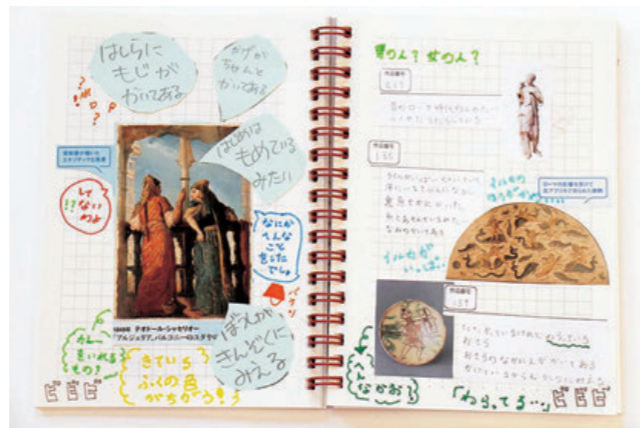
プログラム参加者が制作したブック