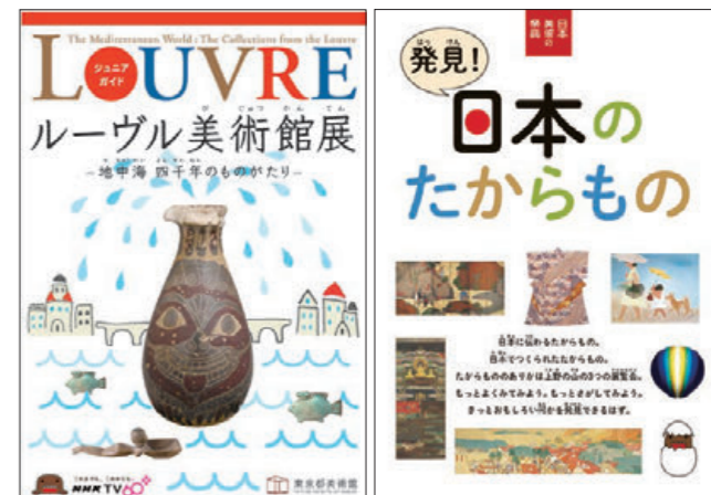
ルーヴル美術館展ジュニアガイド 世紀の日本画展ジュニアガイド